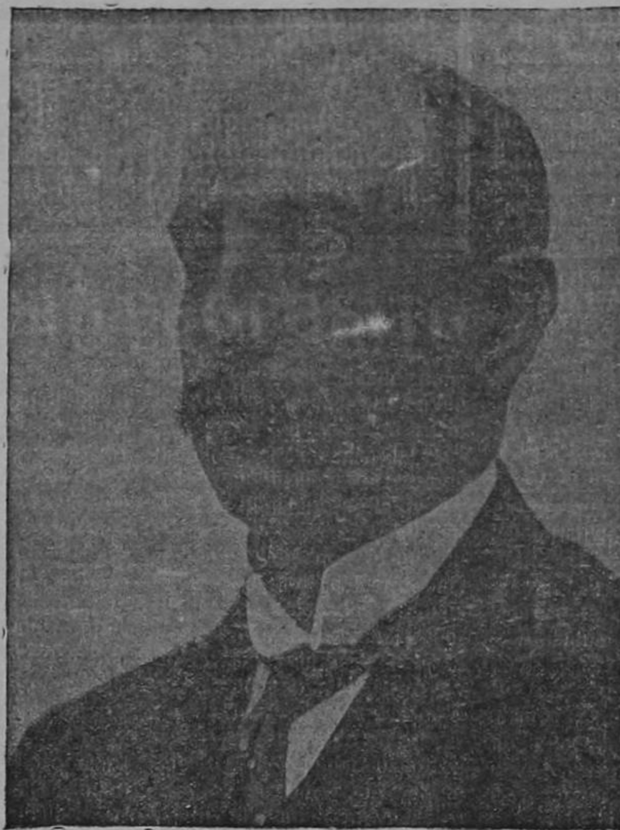
Licenciado don Ricardo Jiménez Oreamuno Candidato del Partido Republicano

Departamento de abarrotes que surte con mercadería fresca y de superior calidad a las gentes de buen gusto. Surtido completo y constantemente renovado. Multitud de comerciantes acuden a estos almacenes por la ventaja que les reporta y esa sí como se ha logrado llevar a todas partes las ventajas que ofrece esta casa.